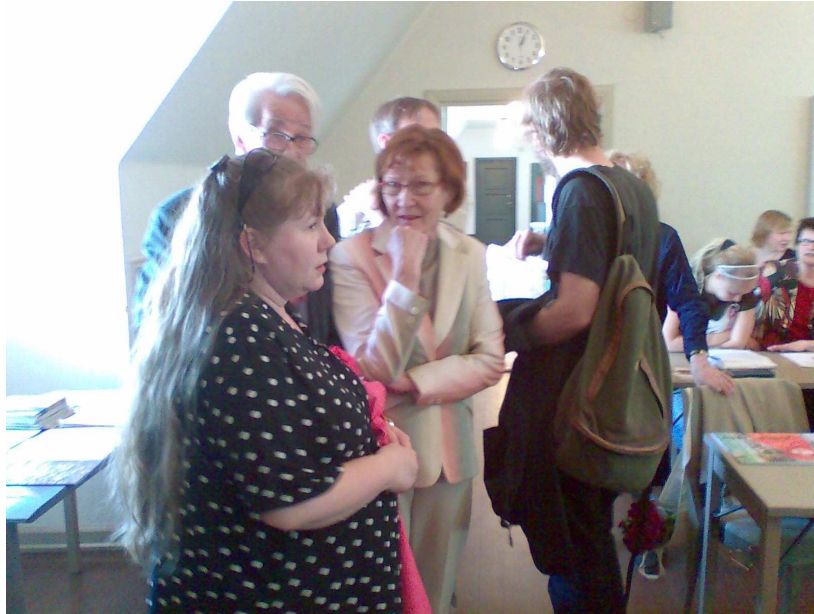
Järjestäjien jännitystä ennen seminaarin alkua.

Kansalaisjärjestöjen yhteisseminaari lauantaina 3.5.2008 klo 13-17 Tieteiden talo, Kirkkokatu 6. Helsinki