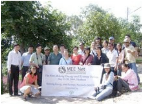
Mee Net Training 7 - MEE Netin energiakoulutustilaisuuden osanottajat toukokuussa 2009.

na 2007 perustettiin uusi Mekongin alueen energia- ja ekologiaverkosto, Mekong Energy and Ecology Network MEE Net ajamaan kestävä ja hajautettua energiapolitiikkaa ja siirtämään kansalaisjärjestöjen toiminta alajuoksulta, patojen ja muiden vahingollisten voimaloiden vastustamisesta, yläjuoksulle, energiapoliittisen päätöksentekoon, ettei suurpatoja tai hiili- tai ydinvoimaa suunniteltaisi lainkaan.