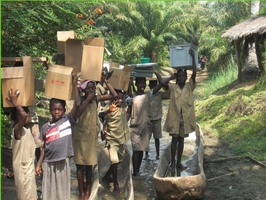
Lapset kantavat sähköistämishankkeen tavaroita kotimatallaan koulusta. Lue sisäsivuilta hankevastaavan kertomus Beninistä.