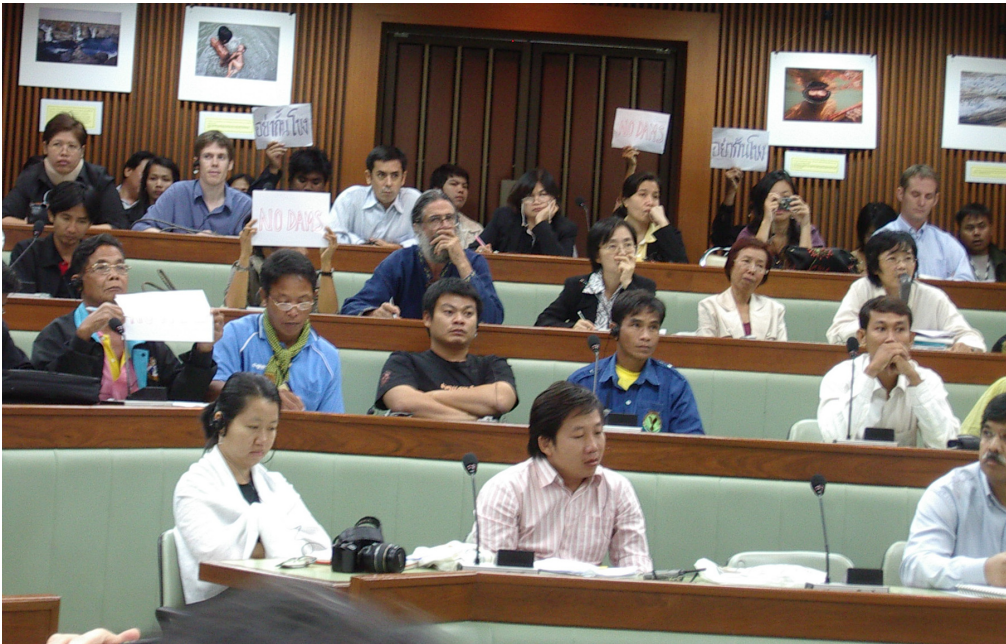
Thaimaan Pak Munin padosta kärsineet ihmiset osoittavat mieltään patoja vastaan (No Dams) Mekong mainstream dams -seminaarissa marraskuussa 2008.

joka pyrkii tekemään paikallista ja valtakunnallista vaikuttamistyötä ympäristön suojelemiseksi.