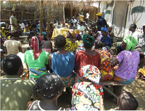
Kyläkokous Tokpa-Aizossa Aurinkosähköhankkeen asennusten käynnistämiseksi

Kyliä naiset ottivat aurinkosähkövalohankkeen omakseen ja osallistuivat runsas-