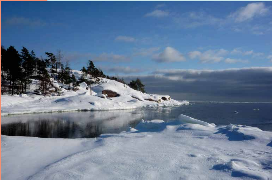
Melkin eteläkärki.

Tekniikka elämää palvelemaan ry Tekniken i livets tjänst Technology for Life